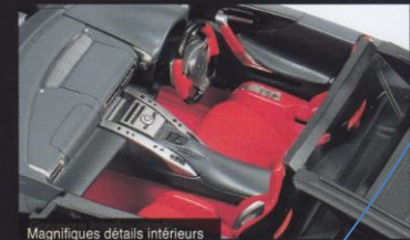
Magnifiques détails intérieurs

reproduit avec le plus grand souci de réalisme, la structure centrale ajourée étant elle aussi en photo-découpe. Les protections avant et arrière amovibles permettent d'admirer le dessous du moteur, la transmission, les suspensions et l'échappement entièrement reproduits. Le capot moteur, agrémenté de grilles en photo-découpe, est amovible pour dévoiler le dessus du moteur. Les pièces chromées sont de deux types, brillant pour les optiques de phares et feux et mat pour les jantes,