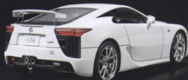
Aileron escamoté ou déployé grâce à un ingénieux système aimanté