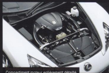
Compartiment moteur entièrement détaillé

La première des 500 LFA qui seront produites a été livrée en décembre 2010 et Tamiya n'a pas perdu de temps pour nous proposer le kit au 1/24 de cette supercar.